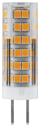
Арт. 25863, 25864, 25865