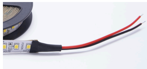
Новая комплектация: провода для подключения к блоку питания