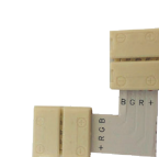
LD185, LD186 LD102, LD106