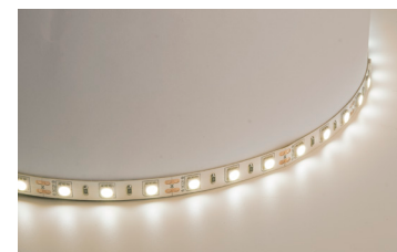
Арт. 27654, 27646