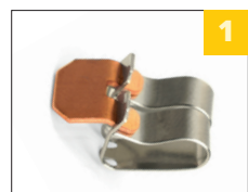
1 латунная контактная группа