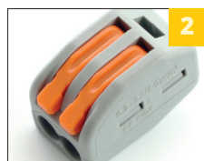
2 не поддерживающий горение корпус