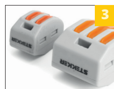
3 логотип на корпусе