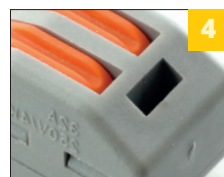
4 окно проверки цепи