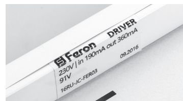
Расположение драйвера вне зоны видимости