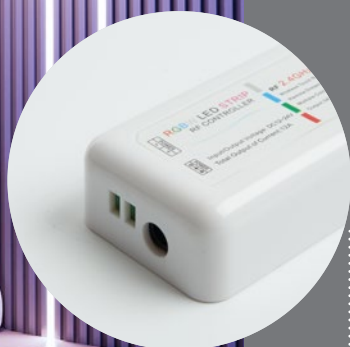
LD63 контроллер для управления режимами работы светодиодных лент

Трехканальный усилитель для монохромных и RGB светодиодных лент представляет из себя устройство, подключаемое в разрыв между отрезками ленты и позволяющее управлять одним контуром с помощью одного контроллера. Максимальный ток нагрузки составляет 24А (3x8А/CH), общая мощность подключаемой нагрузки 288Вт при используемом источнике питания с выходным напряжением 12В и 576Вт – при 24В.