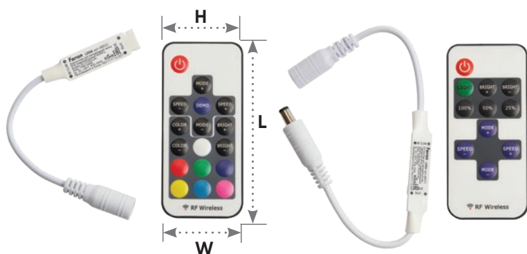
контроллер для RGB-лент