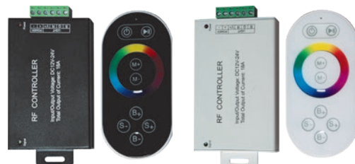
Контроллер RGB с пультом, черный