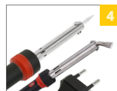
4 широкий диапазон моделей по мощности от 30-300Вт