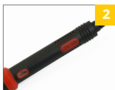
2 эргономичная резиновая ручка