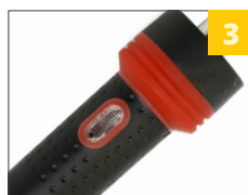
3 Индикатор наличия питания