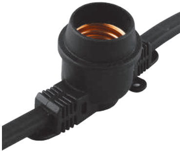
CL25-25, CL25-100, CL50-50, CL50-100